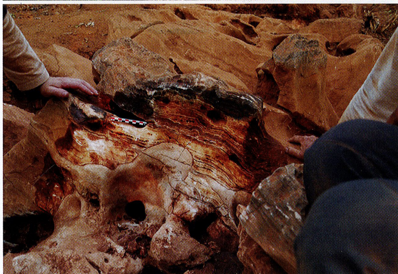
Marc Jarry / Inrap et Traces

La cavité est partiellement remplie de sédiments, mais on sent des courants d'air à l'entrée. Preuve qu'il y a du volume à explorer en dessous...» Des fouilles approfondies pourraient donc être engagées lors de la prochaine expédition, prévue fin 2018. «En général, pour mille fossiles retrouvés, un seul provient d'un hominidé, prévient l'archéologue. Mais il suffirait de retrouver ici un seul fossile d'australopithèque pour démontrer ce que tout le monde pressent déjà : nos lointains ancêtres vivaient dans l'ensemble de l'Afrique. L'Ethiopie et l'Afrique du Sud ne seront alors plus les seuls berceaux de l'humanité.» La quête ne fait que commencer. ■